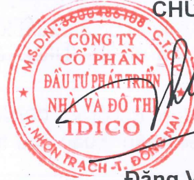
Đặng Việt Dũng